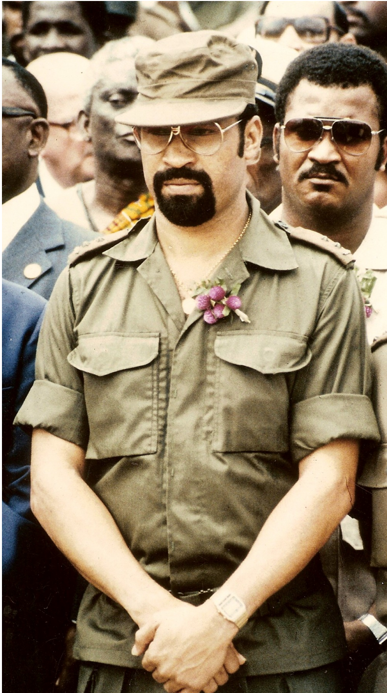
Desi Bouterse in 1985.

In de eerste vijf jaar na de onafhankelijkheid vond enige economische ontwikkeling plaats in Suriname. Het land investeerde echter niet in duurzame groei en evenwichtige sociale ontwikkeling, waardoor de onvrede toenam. Nieuwe parlementaire verkiezingen in maart 1980 zouden die onvrede een uitweg bieden, maar voordat het zover kwam, pleegde een aantal onderofficieren onder leiding van Desi Bouterse vlak daarvoor een militaire coup.