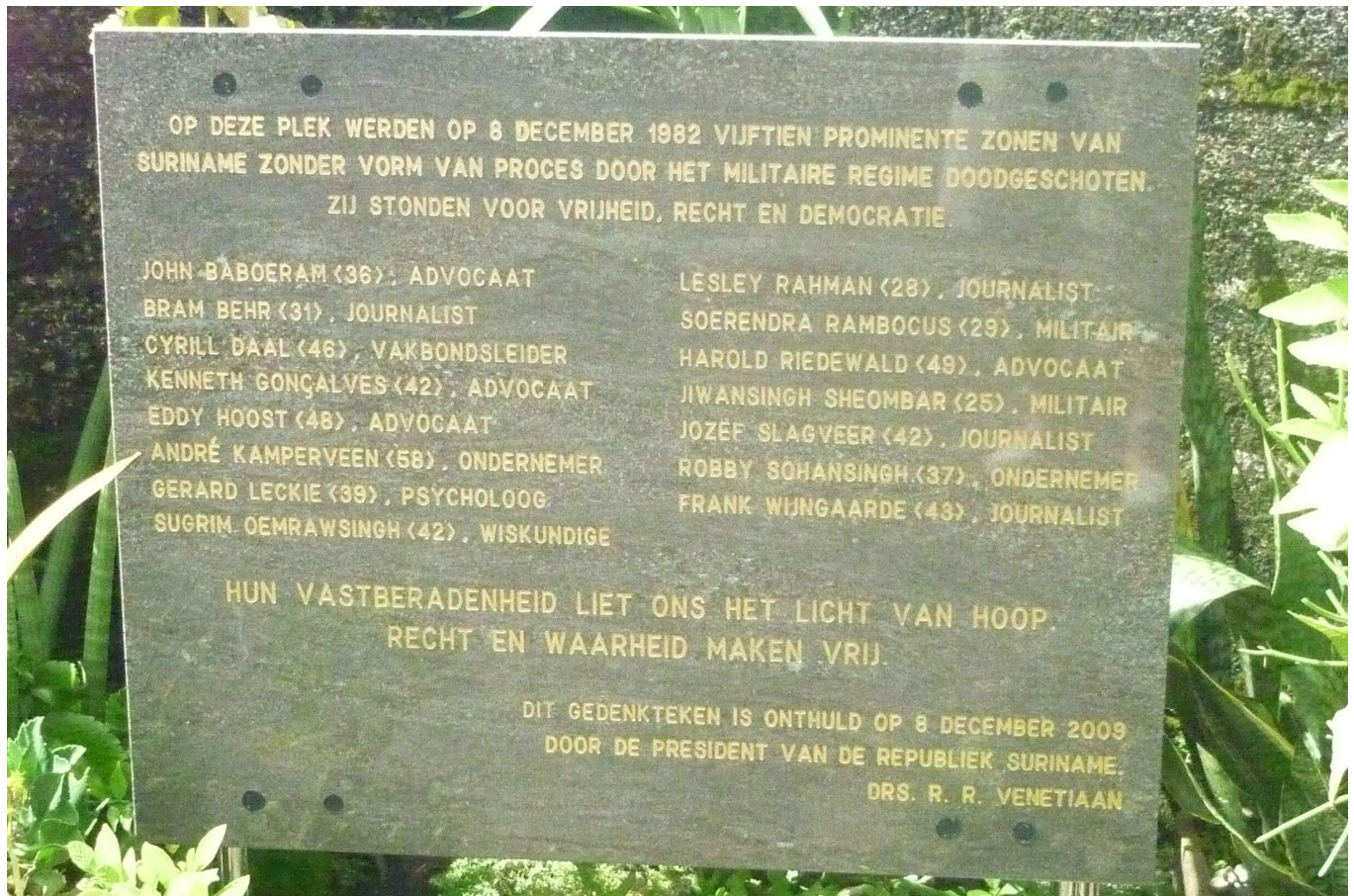
Monument op Fort Zeelandia met de namen van alle slachtoffers van de Decembermoorden.

Dat was althans de kern van de zogeheten Clausula rebus sic stantibus , omschreven in artikel 62 van de Weense Conventie: staten zijn gerechtvaardigd verdragsverplichtingen niet na te komen wanneer de omstandigheden waaronder het verdrag is gesloten fundamenteel zijn gewijzigd, mits (1) de omstandigheden ten tijde van het sluiten van het verdrag bepalend waren voor het sluiten van het verdrag en (2) de wijziging in die omstandigheden als gevolg heeft dat de reikwijdte van de verdragsverplichtingen fundamenteel is veranderd. [16]